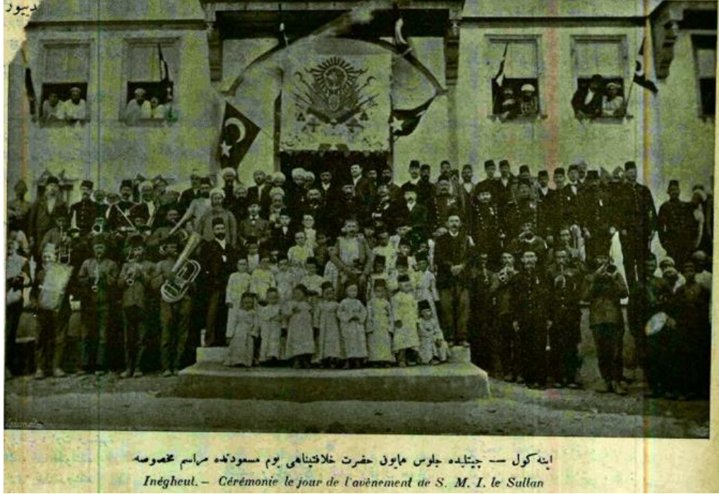
İnegöl Çitli Maden Suyu Otel, Malumat, 5 Kasım 1902.

Çitli Maden Suyuna gelenler için mükemmel bir otel inşa edilmişti. Züvvar (ziyaretçiler) rahatça burada kalabilmekteydi. Şişelerin kullanılmasına dikkat edilir ve kullanılan bir şişe asla yeniden kullanılmazdı. Şişelerin ağzları en kaliteli mantar kapakları ile kapatılırdı. Dolum sağlık ve fen koşullarına uygun yapılmaktaydı. 67