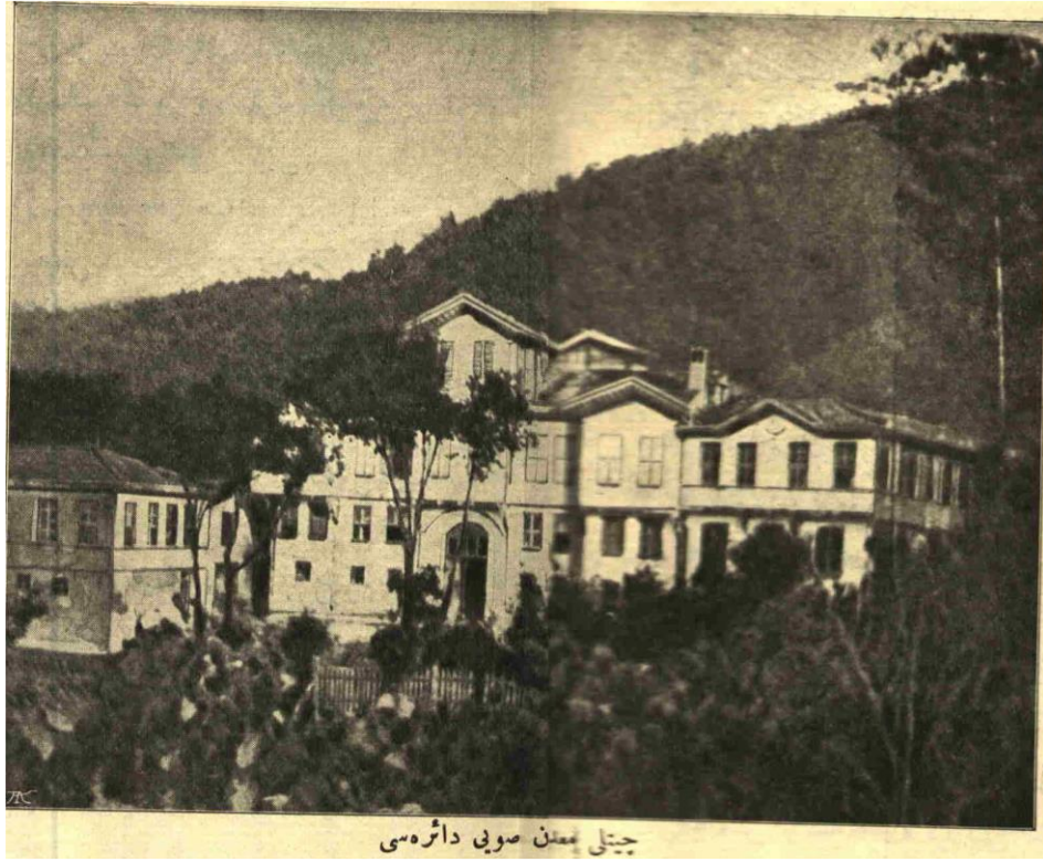
Çitli Maden Suyu Dairesi, Servet-i Fünun 2 Teşrin-i Evvel 1322. M. 15 Ekim 1906.